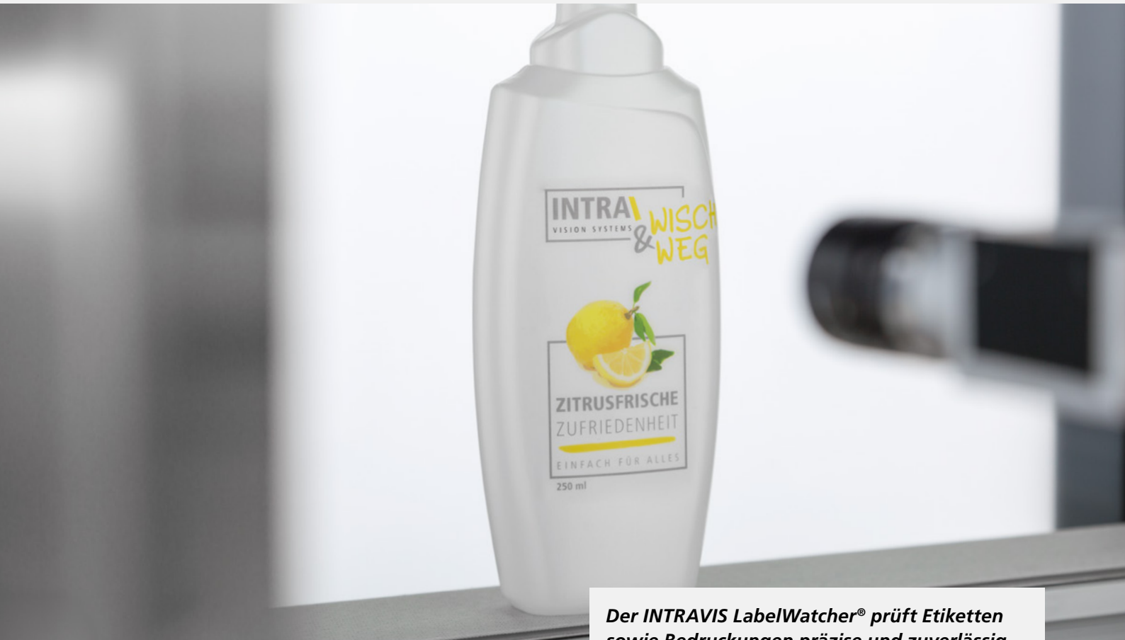
Der INTRAVIS LabelWatcher® prüft Etiketten sowie Bedruckungen präzise und zuverlässig

Der LabelWatcher® ist das universelle Etiketten-Inspektionssystem: Global Player – Etikettierer, Abfüller, sowie Flaschen- und Verschlusshersteller – der Kunststoff-Verpackungsindustrie setzen das Prüfsystem zur Dekorationskontrolle ein und schätzen dabei die einfache Bedienung.