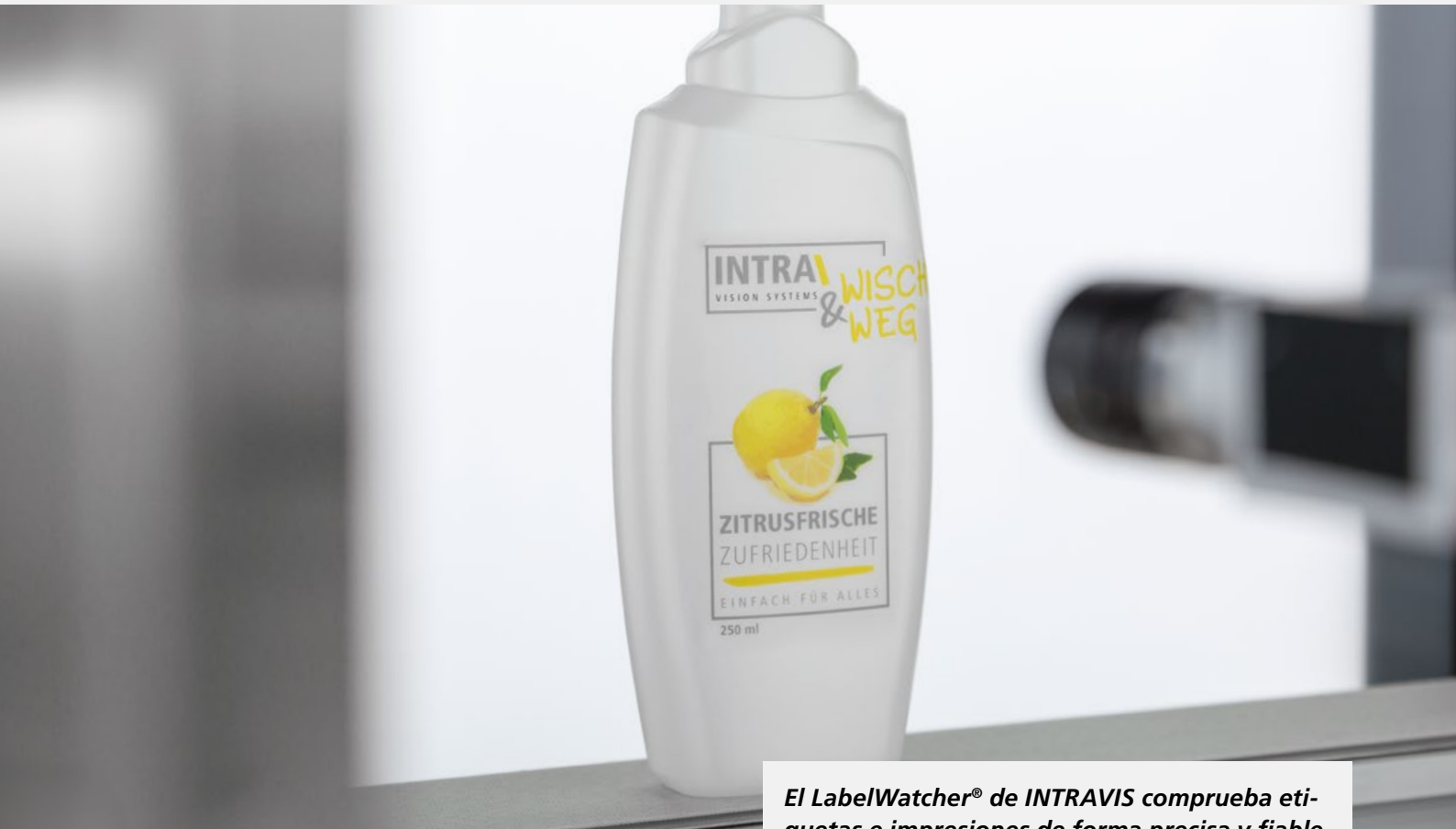
El LabelWatcher® de INTRAVIS comprueba etiquetas e impresiones de forma precisa y fiable

El LabelWatcher® es el sistema de comprobación de etiquetas universal: los actores globales – etiquetadores, embotelladores, así como fabricantes de botellas y tapas – de la industria de los envases plásticos utilizan este sistema de comprobación para el control de la decoración de los envases y estiman su sencillo manejo.